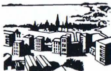
Invanare i städer och samhällen